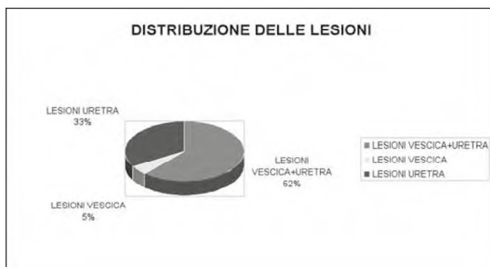
Graf.1: Localizzazione delle lesioni istologiche osservate.

Per quanto concerne la localizzazione delle lesioni osservate mediante l'esame istologico, si sono prese in considerazione le alterazioni che hanno coinvolto il tratto inferiore dell'apparato urinario e quindi la vescica e l'uretra; si è così osservata una maggiore prevalenza di processi infiammatori che coinvolgono contemporaneamente i due organi rispetto a quelli che coinvolgono i due organi singolarmente e precisamente nel 5% dei casi si sono riscontrate lesioni alla vescica, nel 33% all'uretra e nel 62% le lesioni sono localizzate in entrambe.